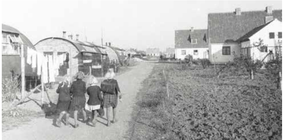
Nissenhütten in der Glückstädter Straße, Ecke Meldorfer Straße in Neumünster (Blickrichtung Heider Straße). Datierung: 10.1951

Die Berichte aus dem Landesteil Schleswig und der Westküste klingen demgegenüber etwas positiver. Der Kreis Eiderstedt berichtete über drei Flüchtlingslager (St. Peter, St. Peter-Böhl und Garding), die vom Reichsarbeitsdienst und der Wehrmacht belegt gewesen waren, sowie einem als Flüchtlingslager genutzten Hotel mit insgesamt befriedigenden hygienischen Verhältnissen. In keinem Fall handelte es sich um Durchgangslager, in allen gab es Desinfektionsmöglichkeiten, Kücheneinrichtungen, im Lager Garding war eine Entlausungsanlage, in St. Peter-Böhl sogar eine Lagerärztin vorhanden. Das alles bei einer Belegung mit rund 500 Personen. Bei den in der damaligen Zeit geringen Ansprüchen schienen es durchaus befriedigende Verhältnisse zu sein. Im Kreis Husum waren Flüchtlinge in Barackenunterkünften immerhin schon in einzelnen Stuben untergebracht. Die ärztliche Versorgung der ca. 150 Perso-