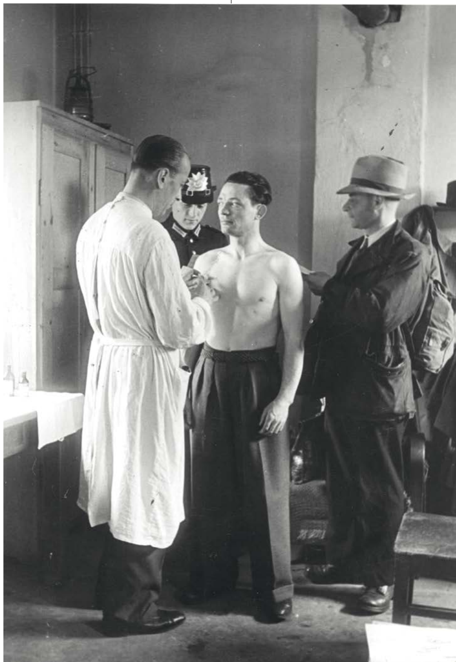
Kein Grenzübertritt ohne Spritze. Ohne Schutzimpfung gegen Typhus durfte aufgrund einer Anordnung der sowjetischen Militärbehörden kein Interzonenreisender die Grenze nach der Sowjetzone überschreiten. Das Bild zeigt eine Ambulanz in einer britischen Grenzübertrittsstelle bei Lübeck, wo jeder Interzonenreisende seine vorgeschriebene Schutzimpfung erhielt.