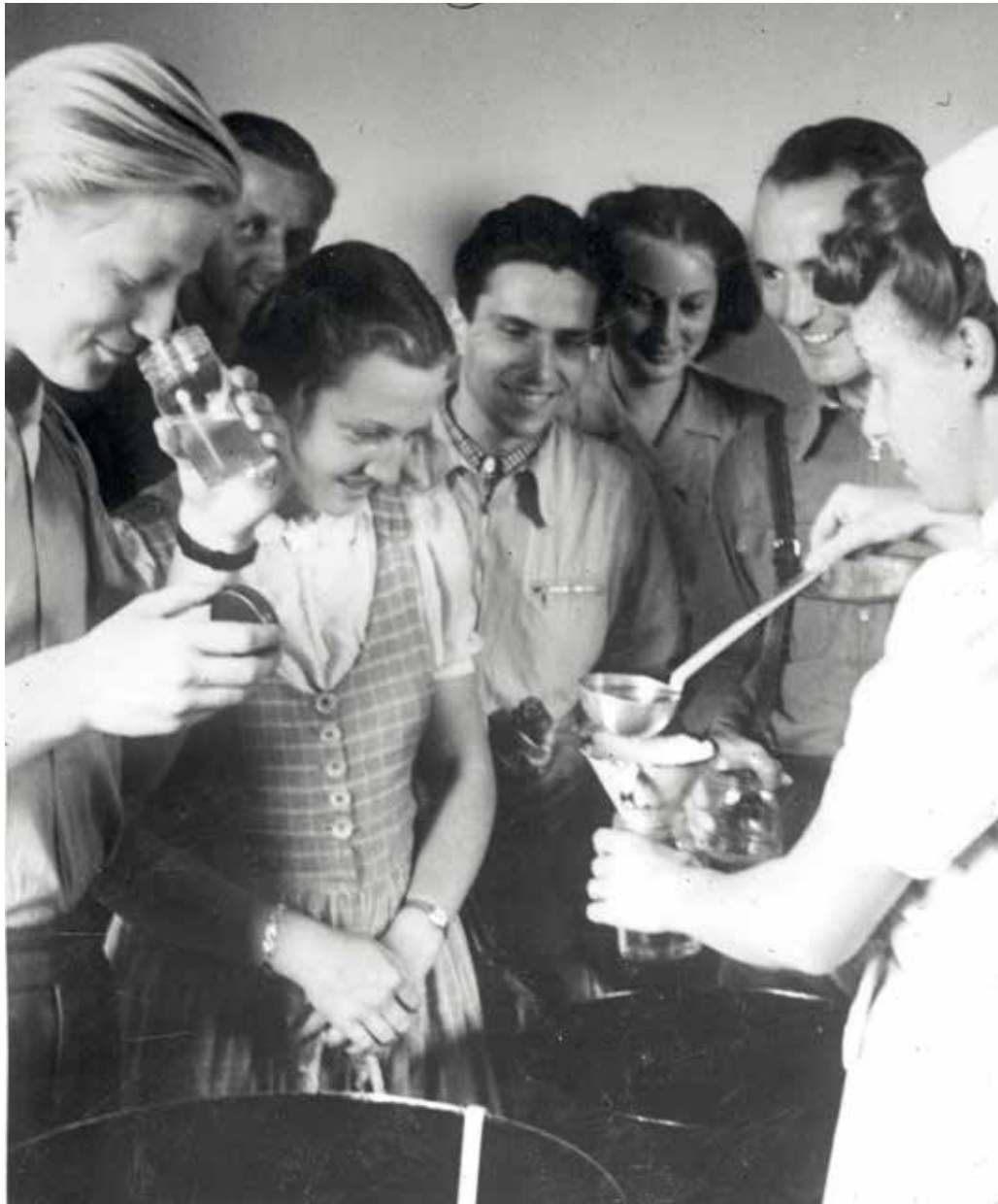
Island-Lebertran für deutsche Studenten, Die ehemaligen isländischen Studenten des Instituts für Weltwirtschaft an der Universität Kiel haben als Zeichen der Verbundenheit mit ihrer alten Lehrstätte 1000 Kilogramm Lebertran zur Verteilung an notleidende Kieler Studenten gestiftet. Unser Bild zeigt die Austeilung des Lebertranks an die Studenten - Trotz Lebertran lauter strahlende Gesichter.

Im April 1946 befanden sich die ehemaligen Wehrmachtlazarette, soweit sie als Krankenhäuser oder zu sonstigen Zwecken des Gesundheitsdienstes benötigt wurden, in der Zuständigkeit der Medizinalabteilung des Amtes für Inneres bzw. der ihm damals noch unterstellten Gesundheitsämter. Einrichtungen und Vorräte einschließ-